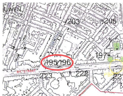
Definitieve aanwijzing: één locatie voor 195/196