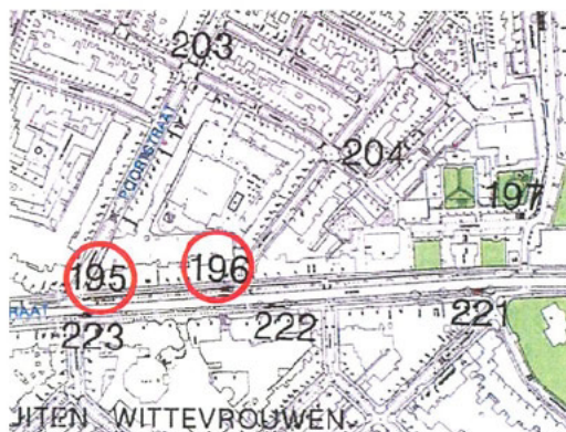
Voorlopige aanwijzing: twee aparte locaties voor 195 en 196